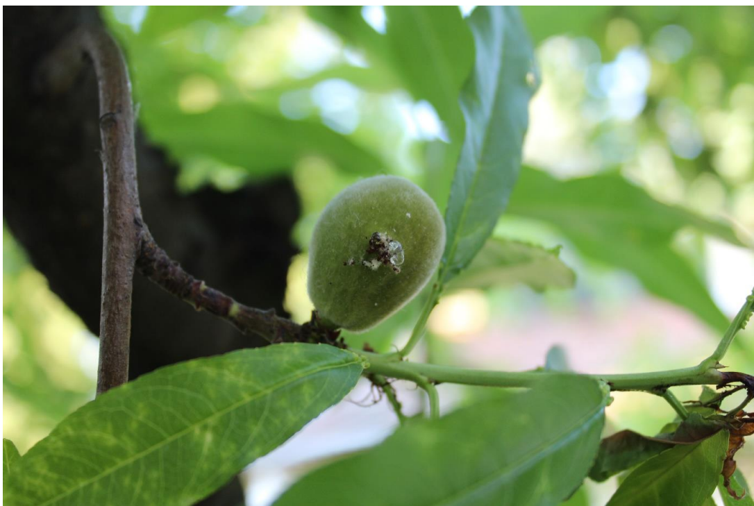
SLIKA 4. SIMPTOM OŠTEĆENJA OD LARVE BRESKVINOG SMOTAVCA NA PLODU

U NAŠIM PROIZVODNIM USLOVIMA BRESKVIN SMOTAVAC RAZVIJA TRI DO ČETIRI GENERACIJE GODIŠNJE, U ZAVISNOSTI OD REGIONA.