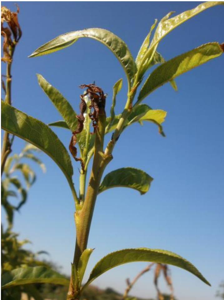
SLIKA 3. SIMPTOM OŠTEĆENJA OD LARVE BRESKVINOG SMOTAVCA NA LASTARU