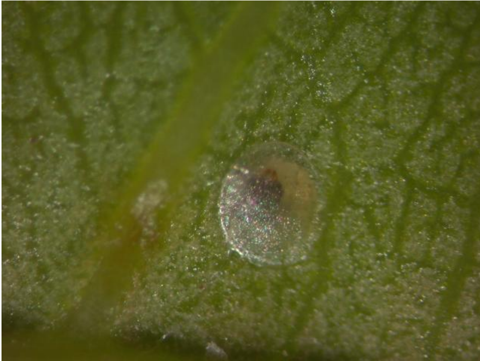
SLIKA 2. JAJE BRESKVINOG SMOTAVCA NA NALIČJU LISTA