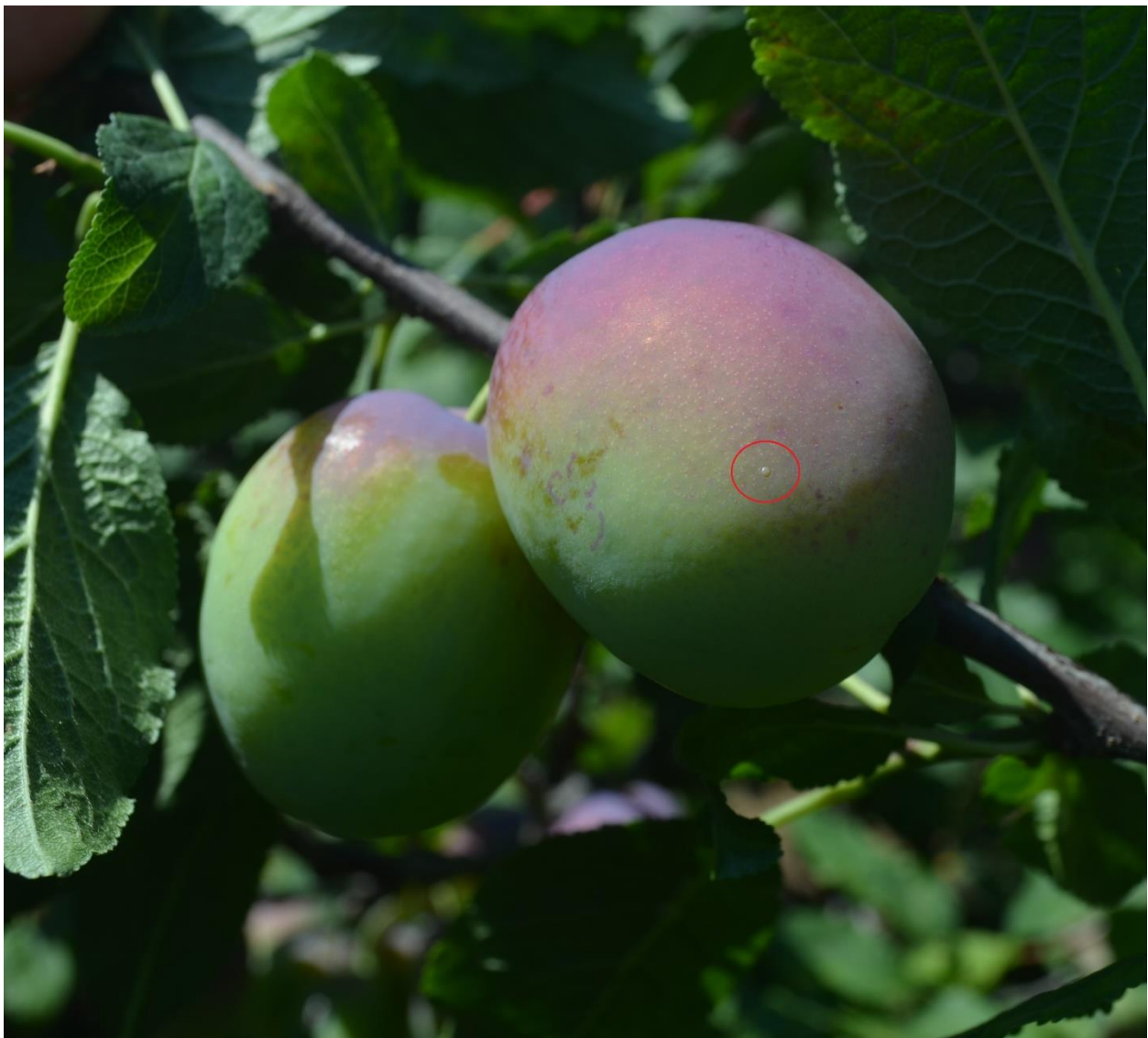
SLIKA 2. JAJE ŠLJIVINOG SMOTAVCA NA PLODU

VIZUELNIM PREGLEDIMA ZASADA ŠLJIVA REGISTROVANA SU JAJA OVE ŠTETOČINE U RAZLIČITIM FAZAMA RAZVOJA KAO I ISPIJENE LARVE. U TOKU JE POČETAK PILJENJA LARVI DRUGE GENERACIJE ŠLJIVINOG SMOTAVCA.