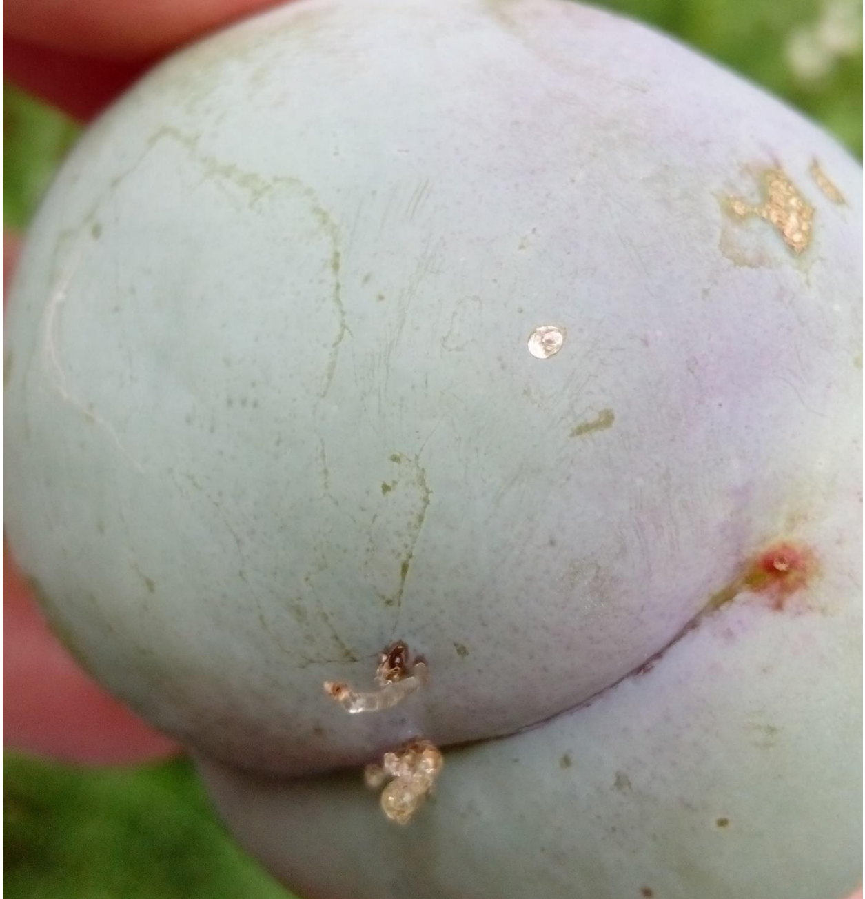
SLIKA 4. ISPIJENO JAJE I ŠTETE OD LARVE ŠLJIVINOG SMOTAVCA NA PLODU

..... POŠTOVANI POLJOPRIVREDNI PROIZVOĐAČI I POŠTOVANI GLEDAOCI, DETALJNIJE INFORMACIJE O POJAVI ŠTETNIH ORGANIZAMA I MERAMA KONTROLE MOŽETE POGLEDATI NA SAJTU PROGNOZNO IZVEŠTAJNE SLUŽBE ZAŠTITE BILJA VOJVODINE WWW.PISVOJVODINA.COM