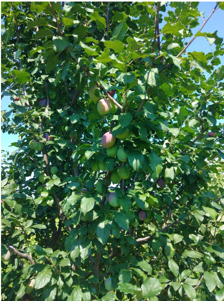
SLIKA 1. FAZA RAZVOJA ŠLJIVE

NA PODRUČJU VOJVODINE ŠLJIVE SE U ZAVISNOSTI OD SORTIMENTA NALAZE U RAZLIČITIM FAZAMA RAZVOJA. KASNE SORTE ŠLJIVA POPUT ČAČNSKE LEPTICE, ČAČANSKE RODNE, ČAČANSKE NAJBOLJE, STENLEJ I GROSE FELICIJA SE NALAZE U FAZI FORMIRANJA PLODA, PLOD OKO 70% KRAJNJE VELIČINE, DOK SE RANE SORTE ŠLJIVA POPUT RUT GERŠTETER I ČAČANSKA RANA NALAZE U FAZAMA OBOJAVANJA PLODA.