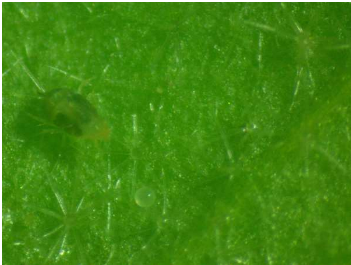
SLIKA 1. ODRASLA JEDINKA I JAJE OBIČNOG PAUČINARA NA LISTU PLAGOVG PATLIDŽANA

OVE ŠTETOČINE ŽIVE NA NALIČJU LISTA GDE SE HRANE SISAJUĆI SOKOVE BILJAKA. PRVI SIMPTOMI NAPADA SE UOČAVAJU NA LICU LISTA U OBLIKU SITNIH PEGA SREBRNASTOBELE BOJE. KAKO SE BROJNOST GRINJA I NAPAD UVEĆAVA, PEGE SE MEĐUSOBNO SPAJAJU I ČITAVA POVRŠINA LISTA ŽUTI I SUŠI SE. KOD NAPADNUTIH BILJAKA POVEĆAVA SE TRANSPIRACIJA, SMANJUJE INTENZITET FOTOSINTEZE ŠTO ZA POSLEDICU IMA SKARAĆENJE VEGETACIJE, ZAOSTAJANJE U PORASTU I FORMIRANJE MANJIH I SITNIJIH PLODOVA.