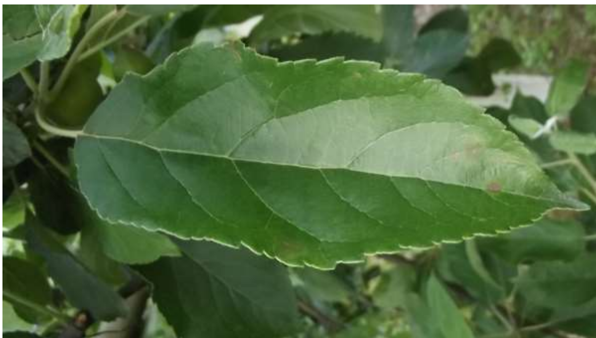
SLIKA 3. SIMPTOMI ČAĐAVE PEGAVOSTI NA LISTU JABUKE (IZ PRETHODNE VEGETACIJE)