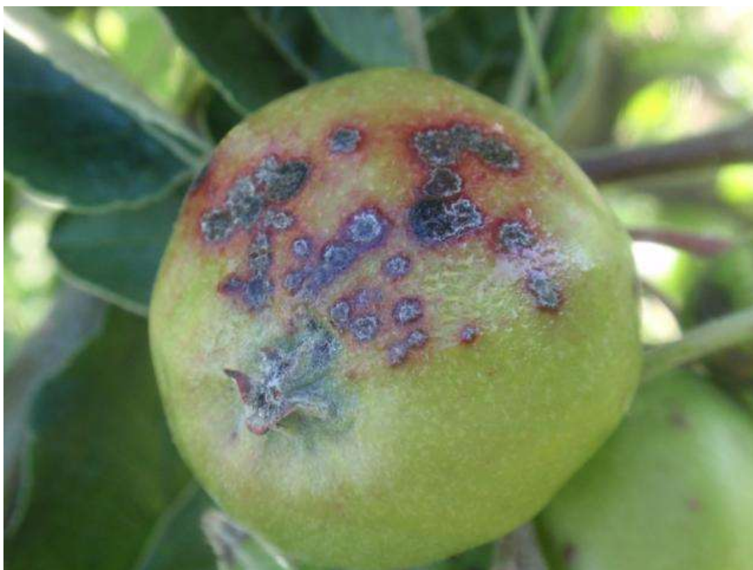
SLIKA 5. SIMPTOM ČAĐAVE KRASTAVOSTI NA PLODU JABUKE (IZ PRETHODNE VEGETACIJE)