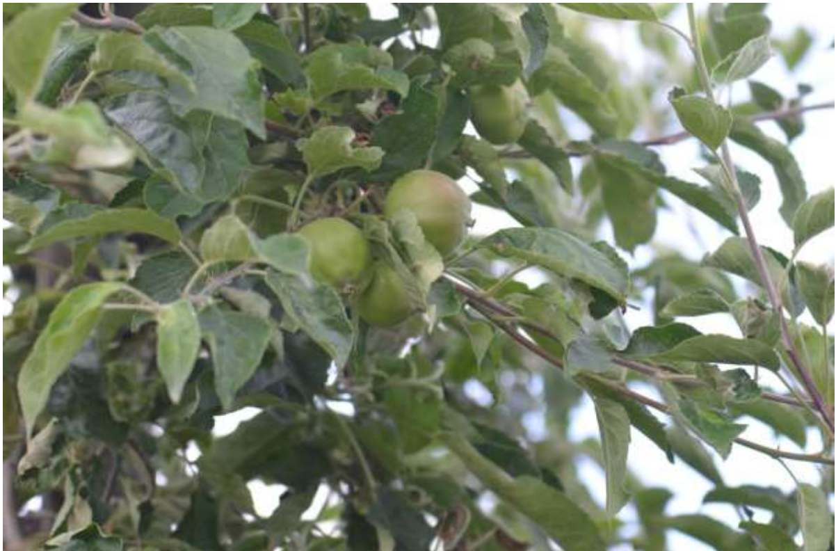
SLIKA 1. FAZA RAZVOJA PLODA, SORTA AJDARED

NA PODRUČJU VOJVODINE JABUKE SE NALAZE U FAZI RAZVOJA PLODA, PREČNIK PLODA JE DOSTIGAO VELIČINU OD 40 MILIMETARA DO POLOVINE KRAJNJE VELIČINE.