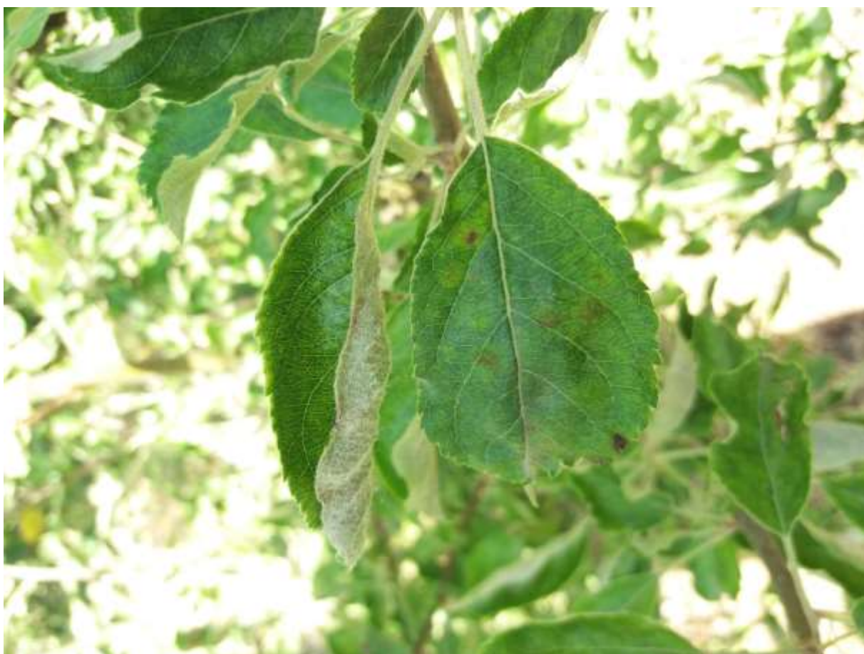
SLIKA 4. SIMPTOMI ČAĐAVE PEGAVOSTI NA LISTU JABUKE (IZ PRETHODNE VEGETACIJE)