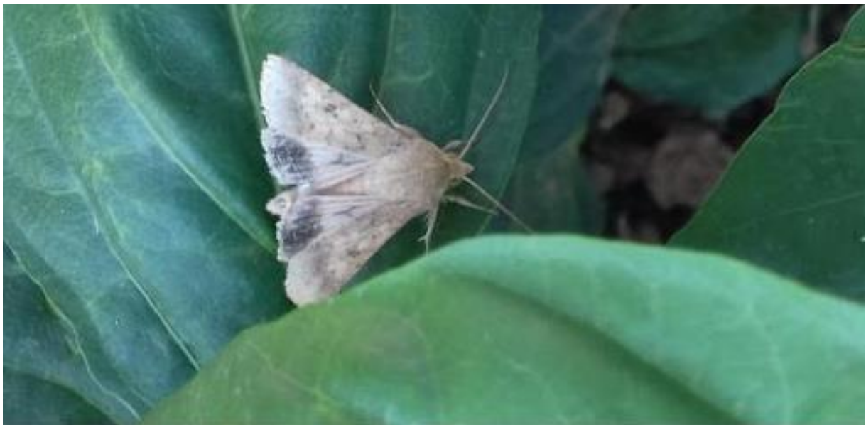
SLIKA 1. IMAGO PAMUKOVE SOVICE

PAMUKOVA SOVICA JE JEDNA OD NAJZNAČAJNIJIH ŠTETOČINA U NAŠOJ POLJOPRIVREDNOJ PROIZVODNJI. MIGRATORNA JE I IZRAZITO POLIFAGNA VRSTA. HRANI SE SA PREKO 250 GAJENIH I SPONTANIH BILJNIH VRSTA.