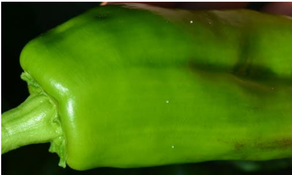
SLIKA 6. JAJA PAMUKOVE SOVICE NA PLODU PAPRIKE