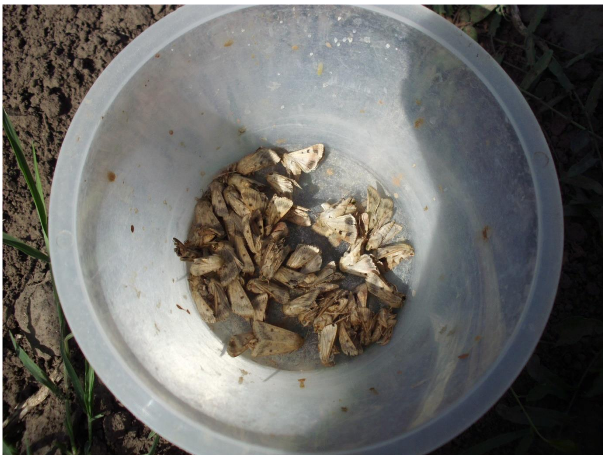
SLIKA 4. ULOVLJENE ODRASLE JEDINKE PAMUKOVE SOVICE NA FEROMONSKOJ KLOPCI

TAKOĐE, U VIZUELNIM PREGLEDIMA USEVA PAPARIKE, U ZAVISNOSTI OD LOKALITETA, REGISTRUJE SE DO 20% BILJAKA SA POLOŽENIM JAJIMA OVE ŠTETOČINE.