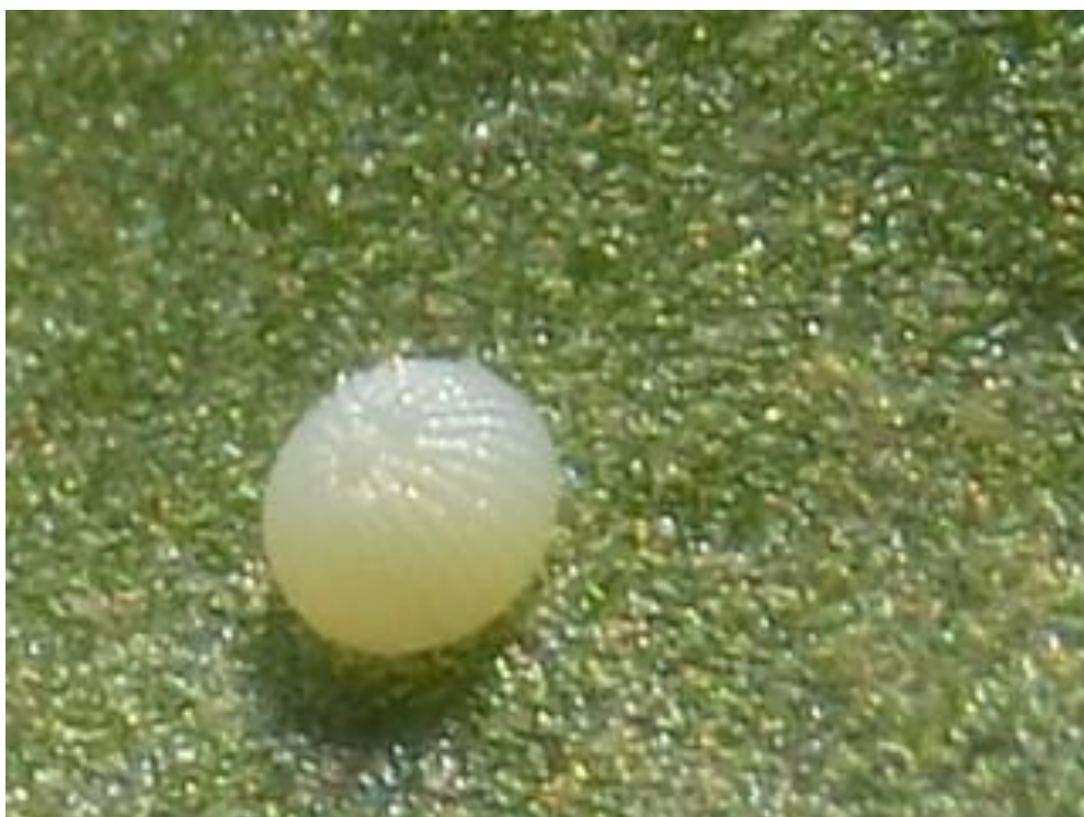
SLIKA 7. JAJE PAMUKOVE SOVICE