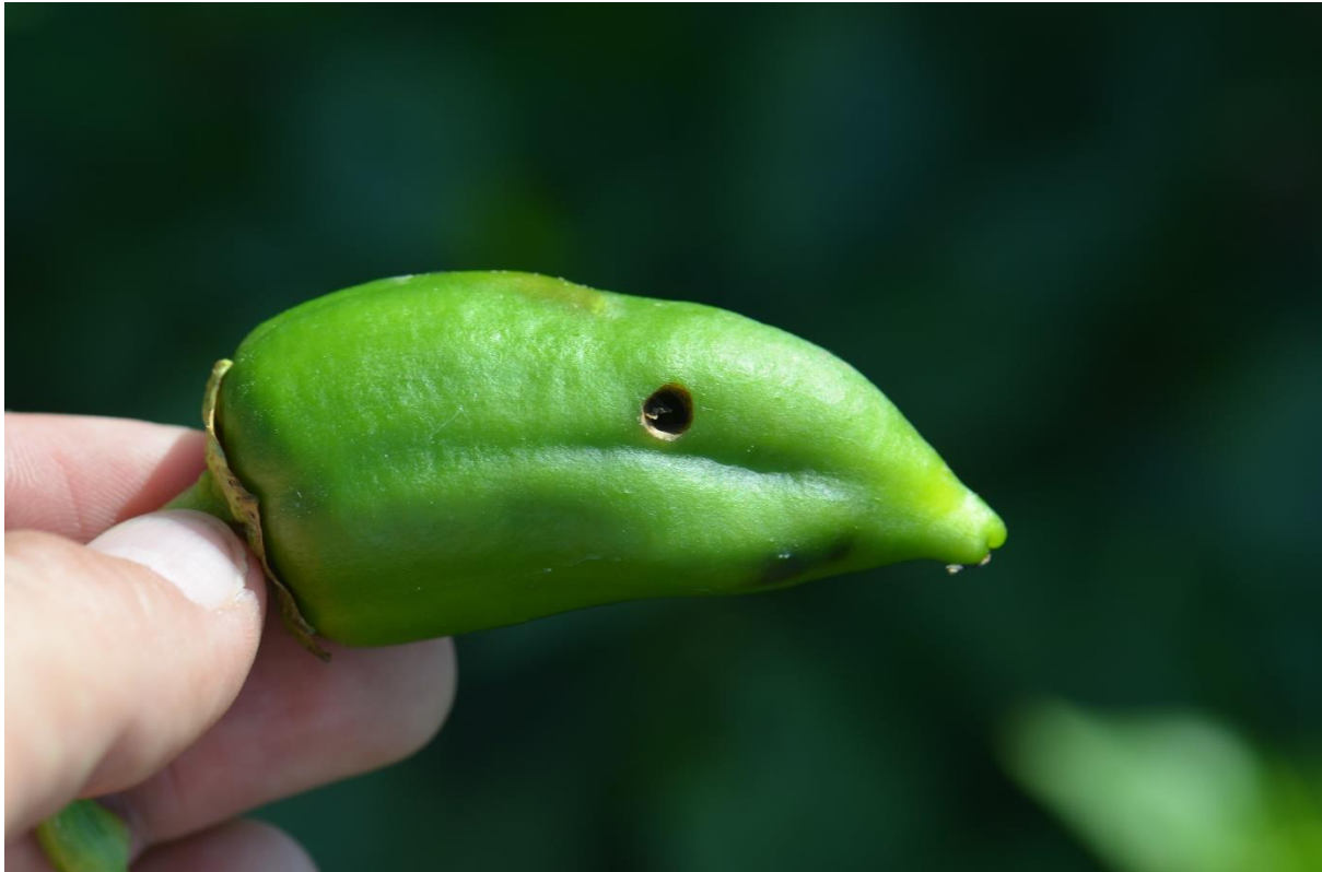
SLIKA 3. OŠTEĆENJE NA PAPRICI OD PAMUKOVE SOVICE

U SISTEMU PROGNOZNO-IZVEŠTAJNE SLUŽBE ZAŠTITE BILJA VOJVODINE PRISUSTVO I DINAMIKA LETA ODRASLIH JEDINKI PRATI SE POMOĆU FEROMONSKIH KLOPKI I SVETLOSNIH LOVNIH LAMPI. PRISUSTVO JAJA I LARVI U USEVIMA, PRATI SE KONTINUIRANIM VIZUELNIM PREGLEDIMA.