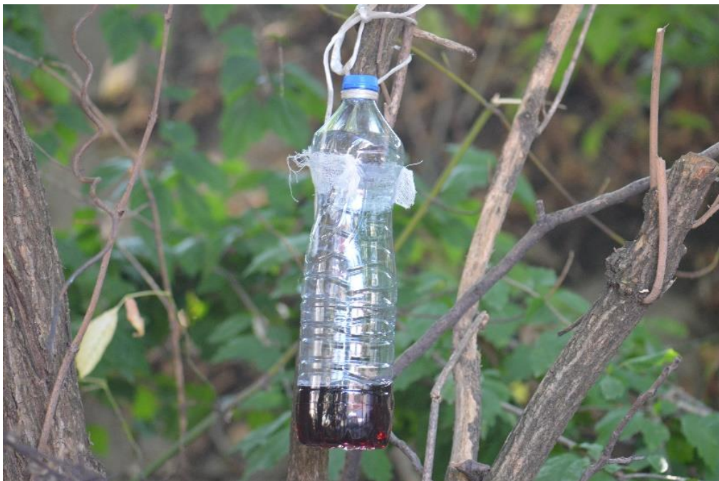
SLIKA 3. KLOPKA ZA AZIJSKU VOĆNU MUŠICU

KAO KLOPKE SE MOGU KORISTITI PLASTIČNE FLAŠE NA KOJIMA JE POTREBNO NAPRAVITI NEKOLIKO OTVORA ZA ULAZAK MUŠICA PREČNIKA 4 MILIMETRA. TAKOĐE, POTREBNO JE NAPRAVITI I OTVORE ZA ŠIRENJE MIRISA KOJI SE PREKRIVAJU GAZOM. KAO MIRISNI ATRAKTANT KORISTI SE MEŠAVINA JABUKOVOG SIRĆETA I CRNOG VINA U ODNOSU 1:1 (1,5 DL JABUKOVOG SIRĆETA I 1,5 DL CRNOG VINA) I PAR KAPI DETERŽENTA ZA SUDOVE. U CILJU MASOVNOG IZLOVLJAVANJA NEOPHODNO JE POSTAVITI VELIKI BROJ KLOPKI, NA IVIČNIM DELOVIMA PARCELE NA RASTOJANJU OD 2 DO 3 METRA, A UNUTAR PARCELE NA RASTOJANJU OD 5 METARA.