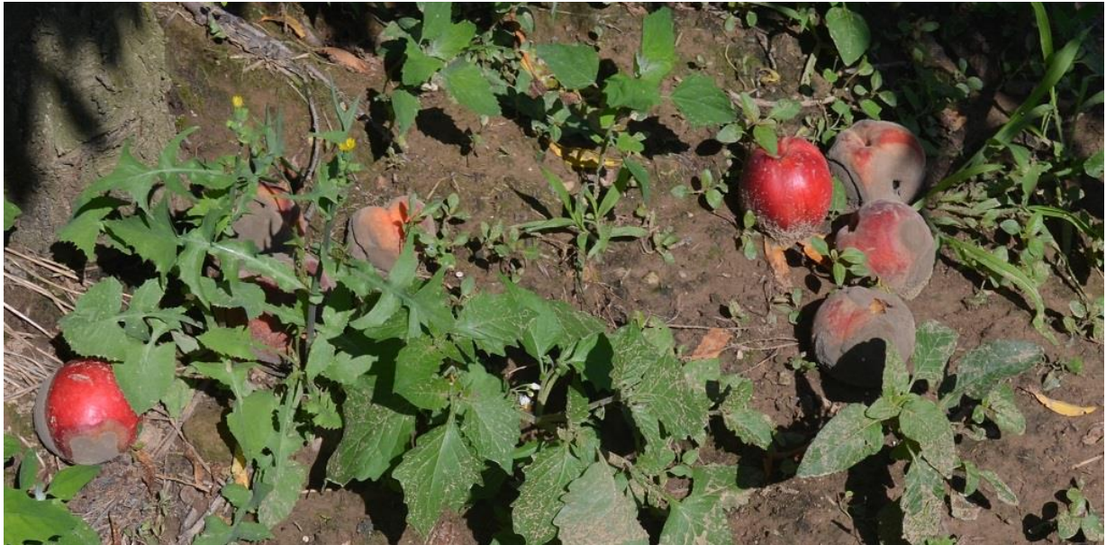
SLIKA 6. PREZRELI PLODOVI BRESKVE KOJI SU OTPALI NA ZEMLJU