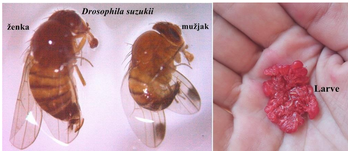
SLIKA 1. ODRASLE JEDINKE I LARVE U PLODOVIMA MALINE

AZIJSKA VOĆNA MUŠICA JE ŠTETOČINA JAGODIČASTOG VOĆA, KOŠTIČAVOG VOĆA I VINOVE LOZE. BILJNE VRSTE NA KOJIMA SE HRANI OVA MUŠICA U OPASNOSTI SU I NAJOSETLJIVIJE SU U VREME ZRENJA. ŠTETE KOJE MOŽE DA IZAZOVE SU I DO 100%. ŽENKE POLAŽU JAJA U ZDRAVE PLODOVE U FAZI ZRENJA. USLED ISHRANE LARVI, PLODOVI POTPUNO PROPADAJU.