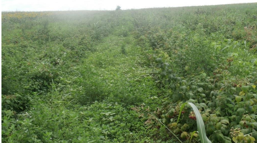
SLIKA 7. NAPUŠTEN ZASAD MALINE

..... POŠTOVANI POLJOPRIVREDNI PROIZVOĐAČI I DRAGI GLEDAOCI, DETALJNIJE INFORMACIJE O POJAVI ŠTETNIH ORGANIZAMA I MERAMA KONTROLE MOŽETE POGLEDATI NA SAJTU PROGNOZNO IZVEŠTAJNE SLUŽBE ZAŠTITE BILJA VOJVODINE WWW.PISVOJVODINA.COM