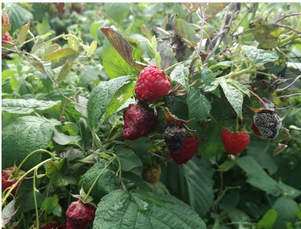
SLIKA 2. ŠTETE NA MALINAMA

NA MESTIMA GDE ŽENKA PRAVI ZAREZE PRILIKOM POLAGANJA JAJA OTVARA SE PUT ZA INFEKCIJE RAZLIČITIM PROUZROKOVAČIMA TRULEŽI.