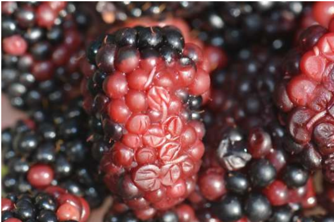
SLIKA 2. LARVE NA PLODOVIMA KUPINE

NA MESTIMA GDE ŽENKA PRAVI ZAREZE PRILIKOM POLAGANJA JAJA OTVARA SE PUT ZA INFEKCIJE RAZLIČITIM VRSTAMA PATOGENA PROUZROKOVAČA TRULEŽI.