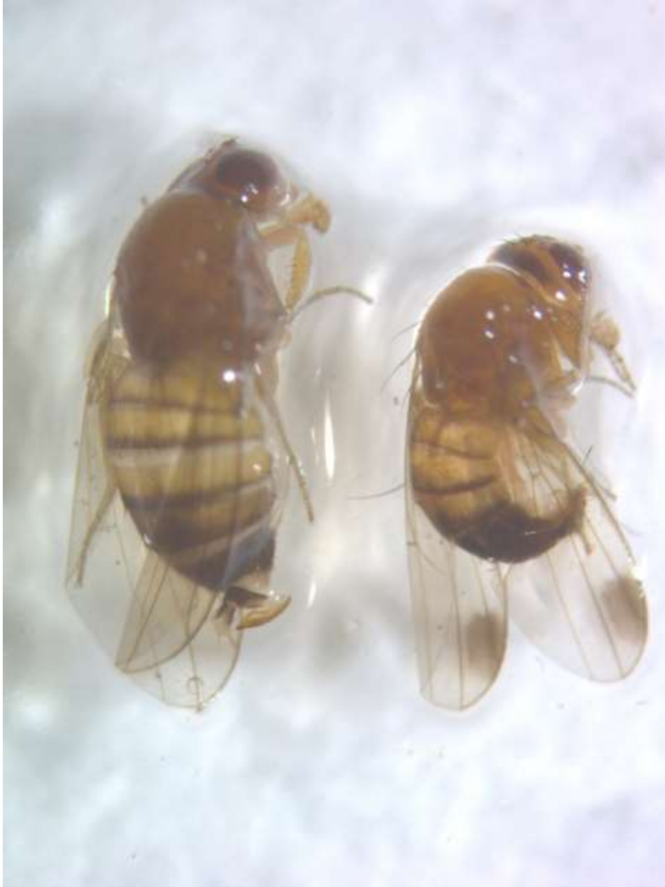
SLIKA 4. ŽENKA I MUŽJAK AZIJSKE VOĆNE MUŠICE

NA POJEDINIM LOKALITETIMA, U ZASADIMA MALINA, KUPINA, BRESAKA I VINOVE LOZE REGISTRUJE SE PRISUSTVO ODRASLIH JEDINKI AZIJSKE VOĆNE MUŠICE. TRENUTNE VREDNOSTI ULOVA ODRASLIH JEDINKI SE KREĆU OKO 10 NA NEDELJNOM NIVOU, ŠTO JE JOŠ UVEK NIZAK RIZIK OD NASTANKA VELIKIH ŠTETA.