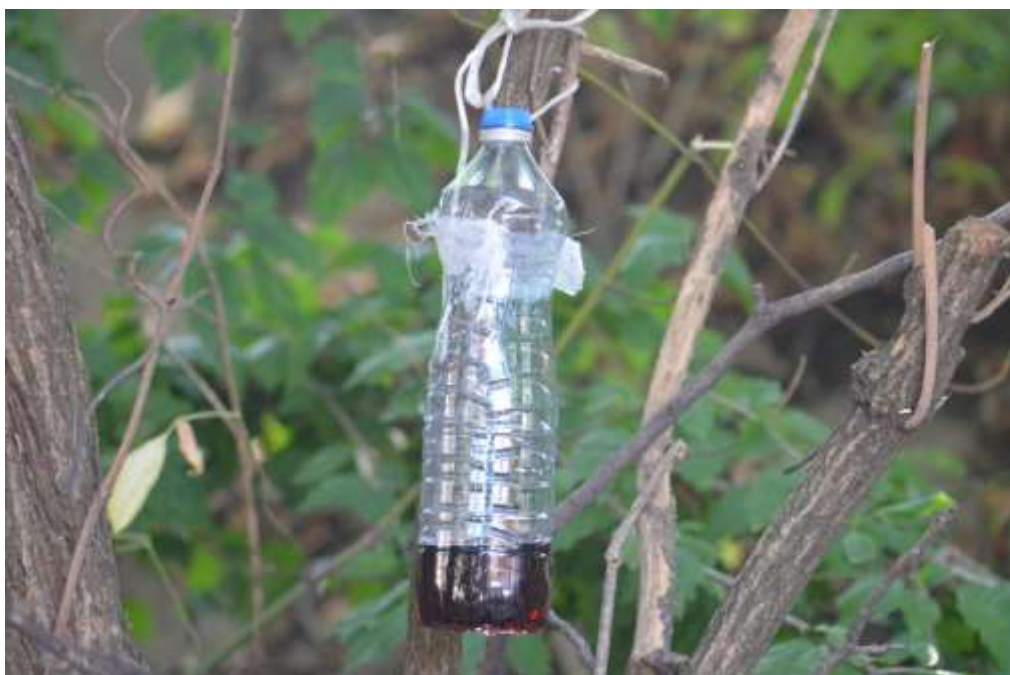
SLIKA 5. KLOPKA ZA AZIJSKU VOĆNU MUŠICU