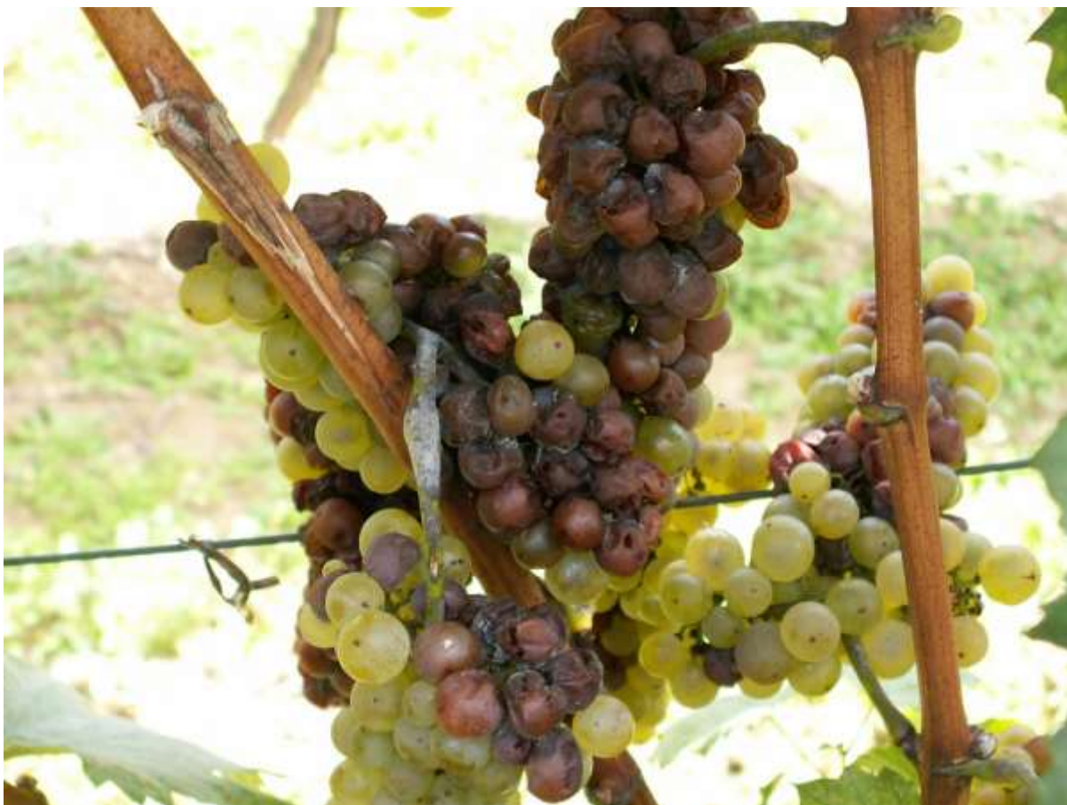
SLIKA 3. ŠTETE NA GROŽĐU

NA MESTIMA GDE ŽENKA PRAVI ZAREZE PRILIKOM POLAGANJA JAJA OTVARA SE PUT ZA INFEKCIJE RAZLIČITIM VRSTAMA PATOGENA PROUZROKOVAČA TRULEŽI.