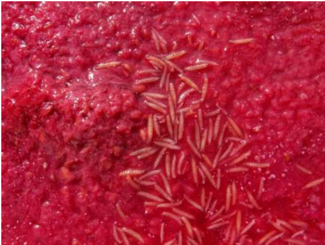
SLIKA 1. KAŠASTI PLODOVI MALINE SA LARVAMA

AZIJSKA VOĆNA MUŠICA JE ŠTETOČINA JAGODIČASTOG VOĆA, KOŠTIČAVOG VOĆA I VINOVE LOZE. BILJNE VRSTE NA KOJIMA SE HRANI VOĆNA MUŠICA U OPASNOSTI SU I NAJOSETLJIVIJE SU U VREME ZRENJA. ŠTETE KOJE MOŽE DA IZAZOVE SU I DO 100%. ŽENKE POLAŽU JAJA U ZDRAVE PLODOVE U FAZI ZRENJA. USLED ISHRANE LARVI PLODOVI POTPUNO PROPADAJU.