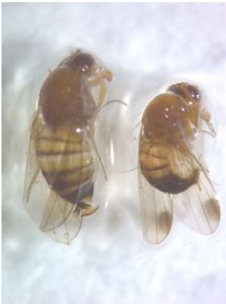
SLIKA 1. ODRASLE JEDINKE AZIJSKE VOĆNE MUŠICE

ŠTETE NA PLODOVIMA NASTAJU USLED POLAGANJA JAJA I ISHRANE LARVI. ZA RAZLIKU OD DRUGIH MUŠICA IZ FAMILIJE DROSOPHILIDAE, ŽENKE OVE MUŠICE IMAJU SPOSOBNOST POLAGANJA JAJA U ZDRAVE PLODOVE I TO ZAHVALJUJUĆI ČVRSTOJ TESTERASTOJ LEGALICI. NAJVEĆE ŠTETE NASTAJU OD ISHRANE LARVI MESOM PLODA. NA MESTIMA GDE ŽENKA PRAVI ZAREZE PRILIKOM POLAGANJA JAJA OTVARA SE PUT ZA INFEKCIJE RAZLIČITIM VRSTAMA PATOGENA.