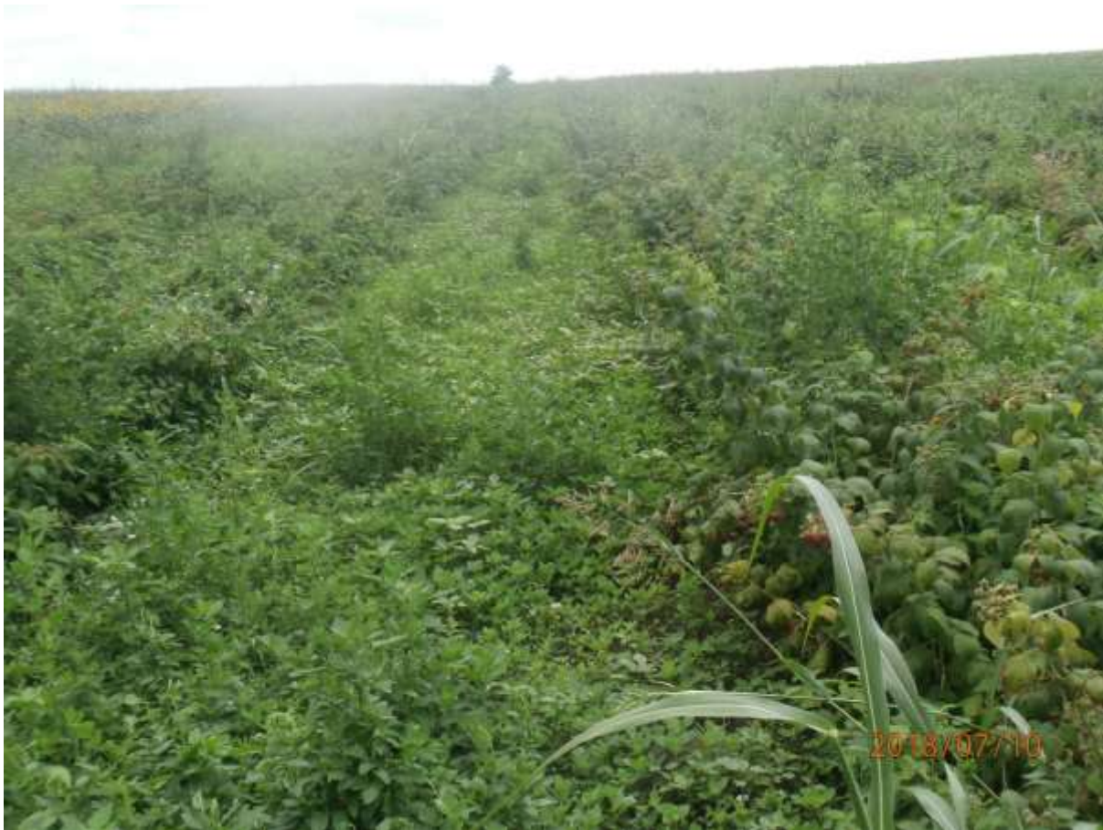
SLIKA 6. NAPUŠTEN ZASAD MALINE

U VIZUELNIM PREGLEDIMA REGISTRUJE SE PRISUSTVO LARVI U PLODOVIMA MALINE, KUPINE I VINOVE LOZE KAO I SIMPTOMI TRULEŽI NA NAPADNUTIM PLODOVIMA.