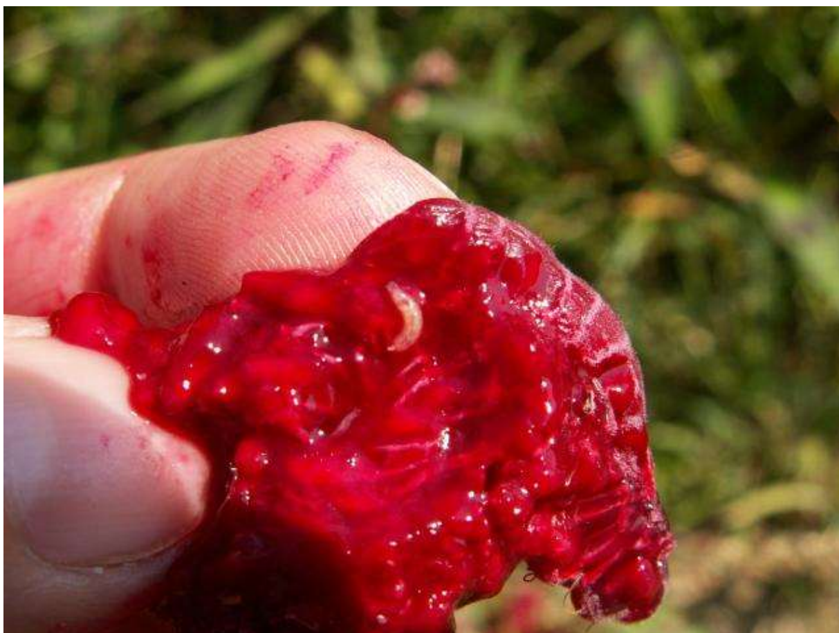
SLIKA 4. LARVA U PLODU MALINE