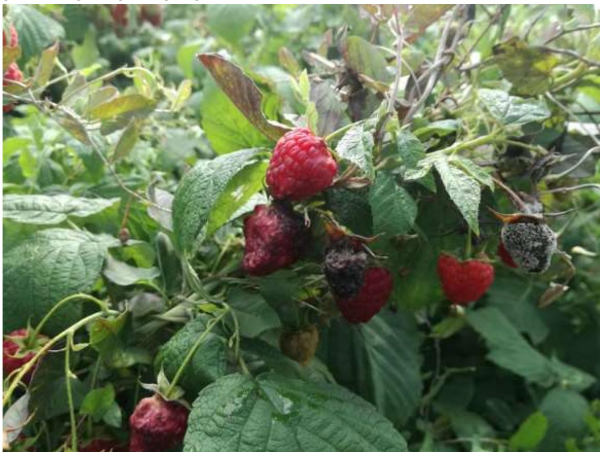
SLIKA 3. ŠTETE U ZASADU MALINE