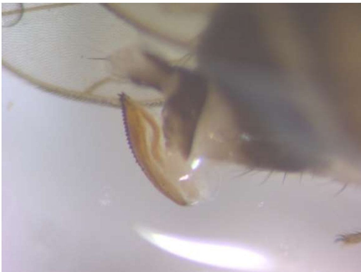
SLIKA 2. TESTERASTA LEGALICA ŽENKE