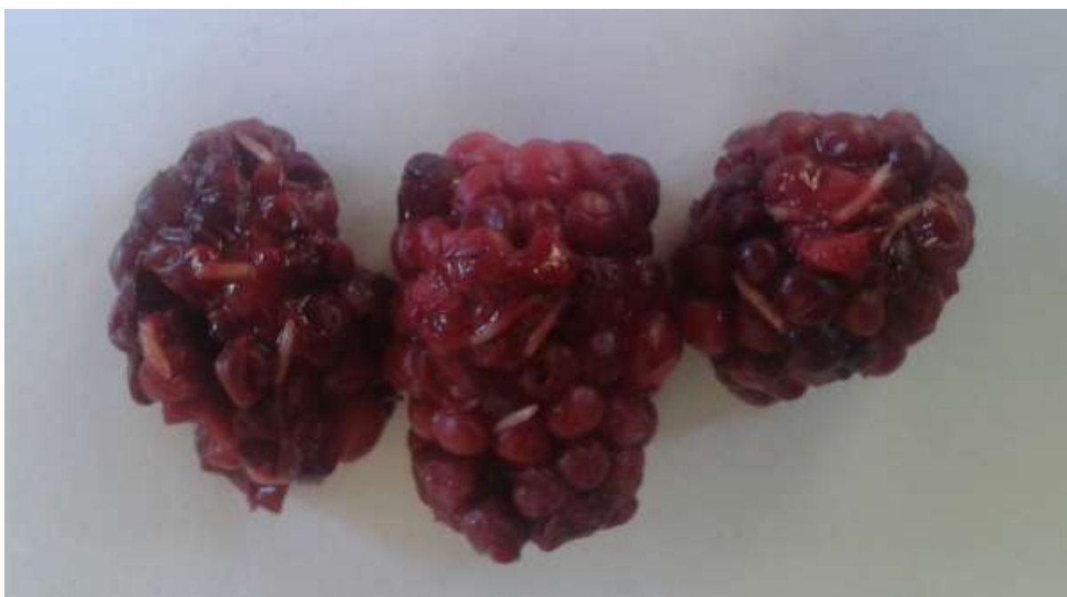
SLIKA 5. LARVE NA PLODOVIMA KUPINE

U POSLEDNJIH NEDELJU DANA DOŠLO JE DO DRASTIČNOG POVEĆANJA BROJNOSTI ODRASLIH JEDINKI AZIJSKE VOĆNE MUŠICE U LOVNIM KLOPKAMA. ZNAČAJAN FAKTOR U PODIZANJU POPULACIJE OVE ŠTETOČINE PREDSTAVLJAJU NAPUŠTENI ZASADI MALINA NA