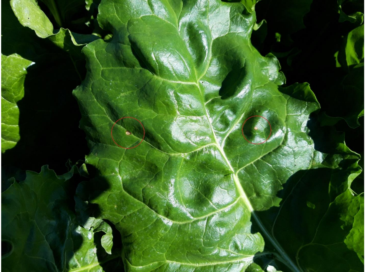
SLIKA 2. SIMPTOM PROUZROKOVAČA PEGAVOSTI LISTA ŠEĆERNE REPE

PRE DVE NEDELJE INFORMISALI SMO VAS O PRISUSTVU SIMPTOMA PEGAVOSTI LISTA ŠEĆERNE REPE I POTREBI SPROVOĐENJA HEMIJSKIH MERA ZAŠTITE U CILJU SUZBIJANJA NAVEDENOG PATOGENA. TOKOM OVE NEDELJE VIZUELNIM PREGLEDIMA USEVA ŠEĆERNE REPE REGISTROVANO JE POVEĆANJE BROJA BILJAKA SA PEGAMA.