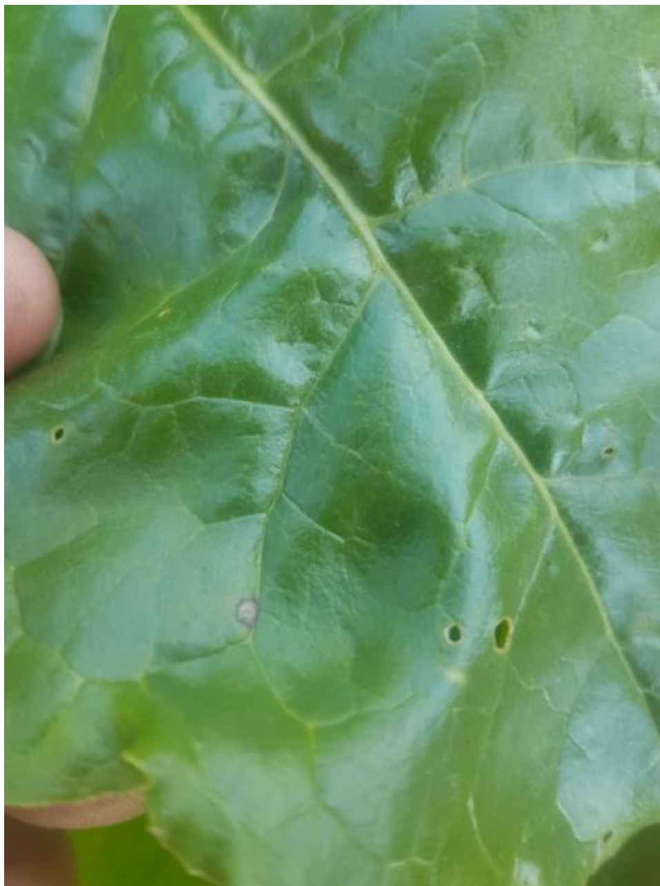
SLIKA 3. SIMPTOM PROUZROKOVAČA PEGAVOSTI LISTA ŠEĆERNE REPE